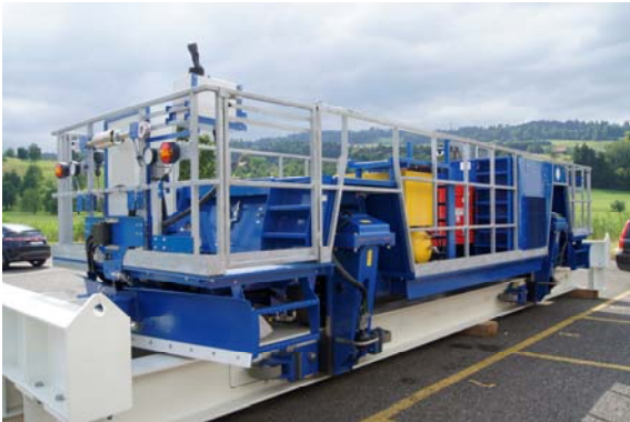
Not- Service- und Reinigungsfahrzeug zugleich