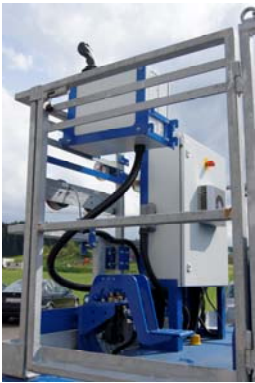
Hier wird das Fahrzeug gesteuert