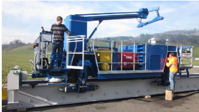
Montage und Tests im Hause ATP Hydraulik in Küssnacht am Rigi Eine Teststrecke von 55 m wurde auf dem Areal der ATP Hydraulik aufgebaut