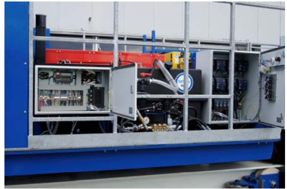
Elektrische Steuerungen am Fahrzeug